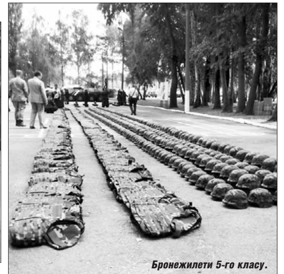
Бронежилети 5-го класу.